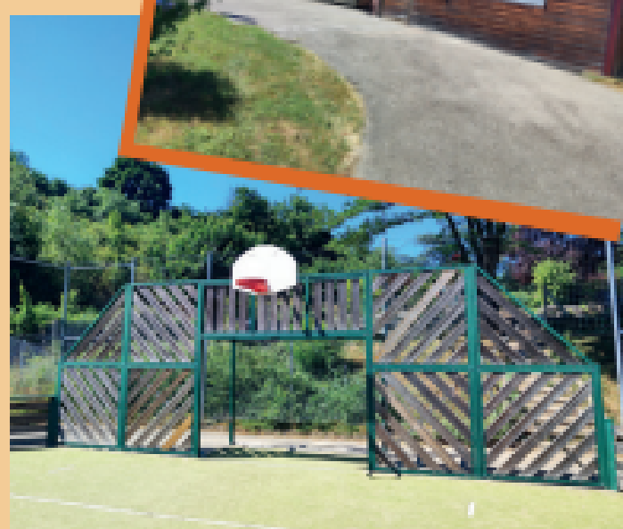
L'ESPLANADE DU CHAMBARO