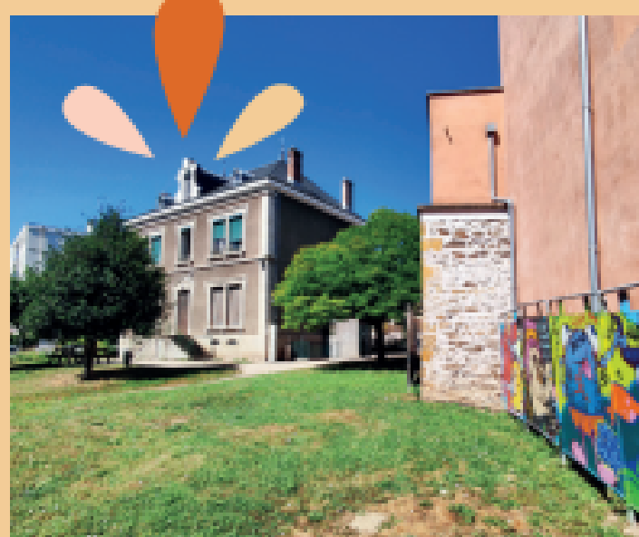
LA MAISON CHARLET